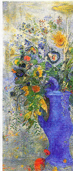
ルドンの「グラン・ブーケ(大きな花束)」(1901年、三菱一号館美術館蔵) 写真上と、「蜘蛛」(1887年、岐阜県美術館蔵)

黒の深く沈着な美も悪く ない。三菱一号館美術館 (東京・丸の内)で開催 中の「ルドンとその周辺 —夢見る世紀末—展は、 闇から色彩の世界へと移 行したルドンの劇的な変 容を鮮やかな展示構成で